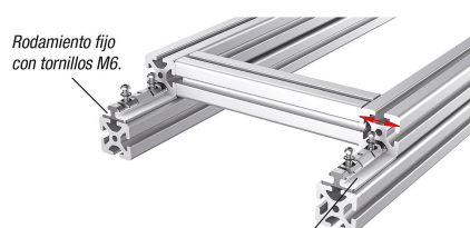
Rodamiento fijo con tornillos M6.