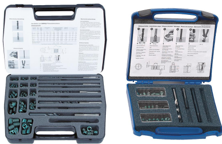
Caja de surtido de materiales